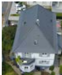
Casa a Wiesloch